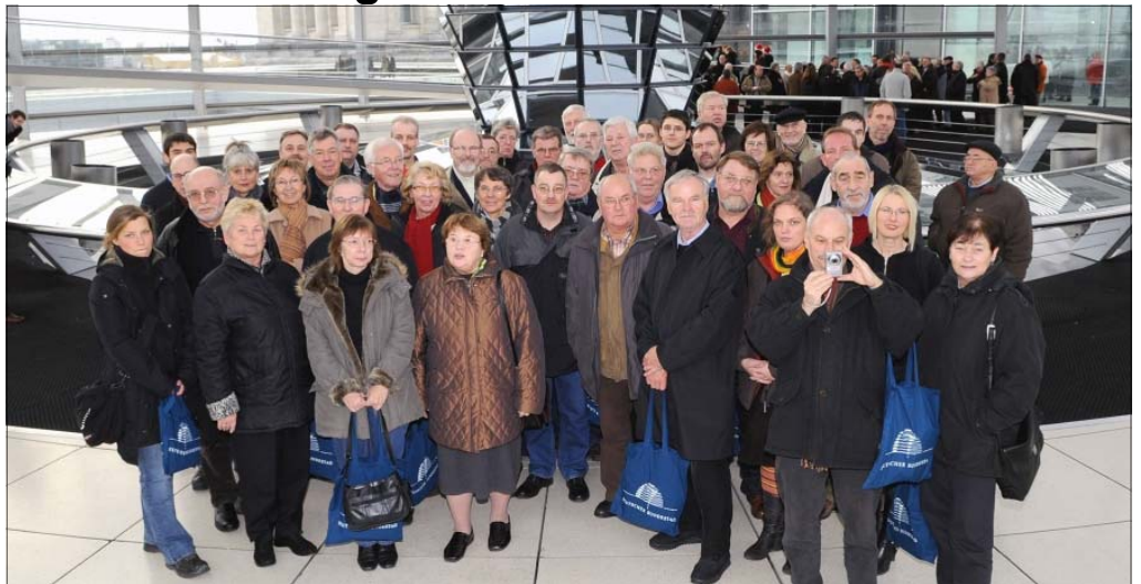
Auf Einladung von Gabriele Hiller-Ohm und Franz Thönnies waren 50 Bürgerinnen und Bürger aus dem Wahlkreis Lauenburg - Stormarn-Süd für drei Tage in Berlin auf einer Fahrt des Bundespresseamtes zu Gast. Hiller-Ohm und Thönnies betreuen den Wahlkreis 10, in dem es derzeit keinen SPD-Bundestagsabgeordneten gibt.